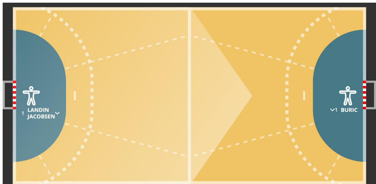
Abbildung 3: Die Abgrenzung der einzelnen Zonen auf dem Spielfeld.

Die Abgrenzung der Positionen erfolgt mittels vorgegebener Raster, das über das Spielfeld gelegt ist.